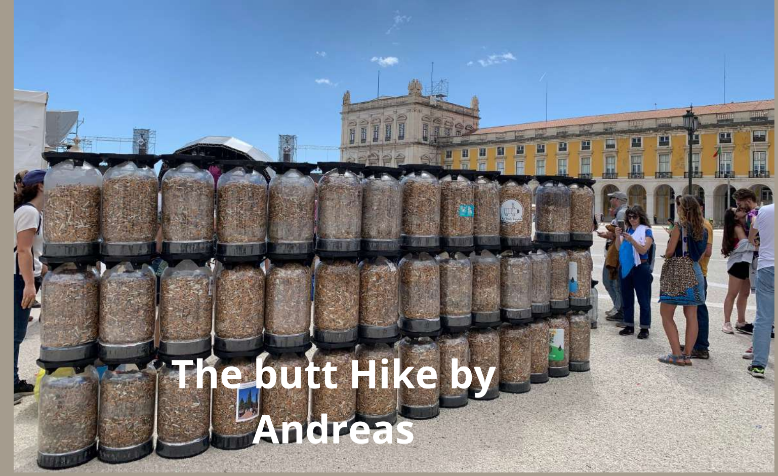
The butt Hike by Andreas